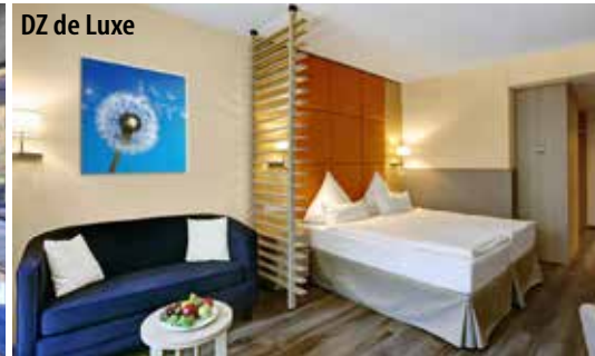
DZ de Luxe