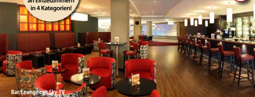
Bar/Lounge mit Sky-TV