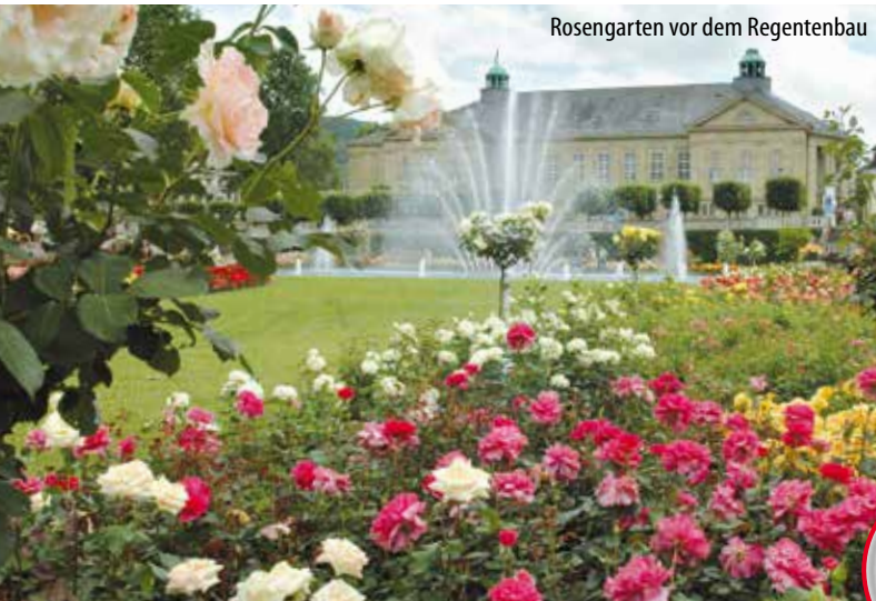
Rosengarten vor dem Regentenbau