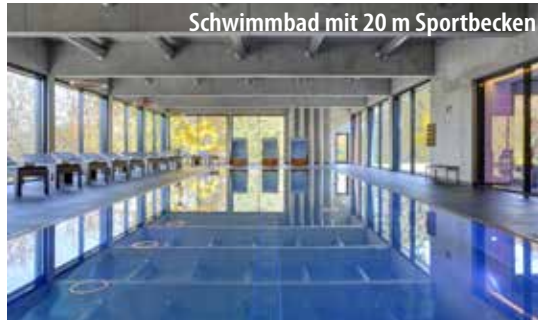
Schwimmbad mit 20 m Sportbecken