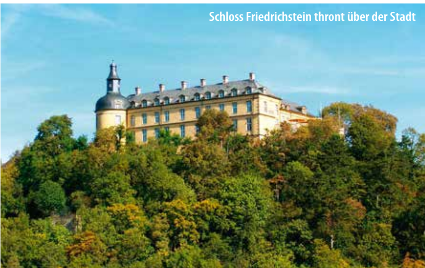
Schloss Friedrichstein thront über der Stadt