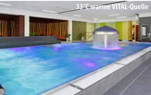
33°C warme VITAL-Quelle