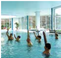
FIT IM ALLTAG