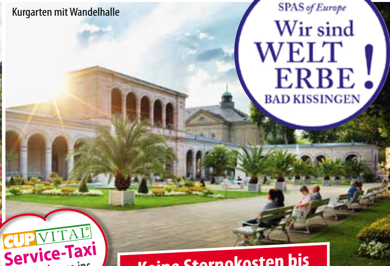
Kurgarten mit Wandelhalle