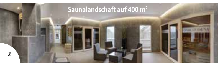
Saunalandschaft auf 400 m 2

* Die Kurtaxe (3,60 € p. P./Tag) ist vor Ort zu zahlen.